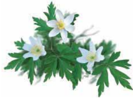
Bosanemonen kleuren het voorjaarsbos wit.

loofbossen die in de winter kaal zijn. Daar komen ze in het vroege voorjaar met hun witte stervormige bloemen boven de grond, om later in het seizoen, wanneer de bomen dicht in het blad staan, weer tot de volgende lente onder te duiken. Ze hebben een vochtige, humusrijke grond nodig.