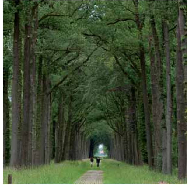
Machtige oude lanen kenmerken het landgoed.

Het hele landgoed straalt rust, harmonie en afwisseling uit. Neem er de tijd voor, net zoals de mensen in de Achterhoek de tijd nemen om te leven, en waan je al wandelend in de zeventiende eeuw.