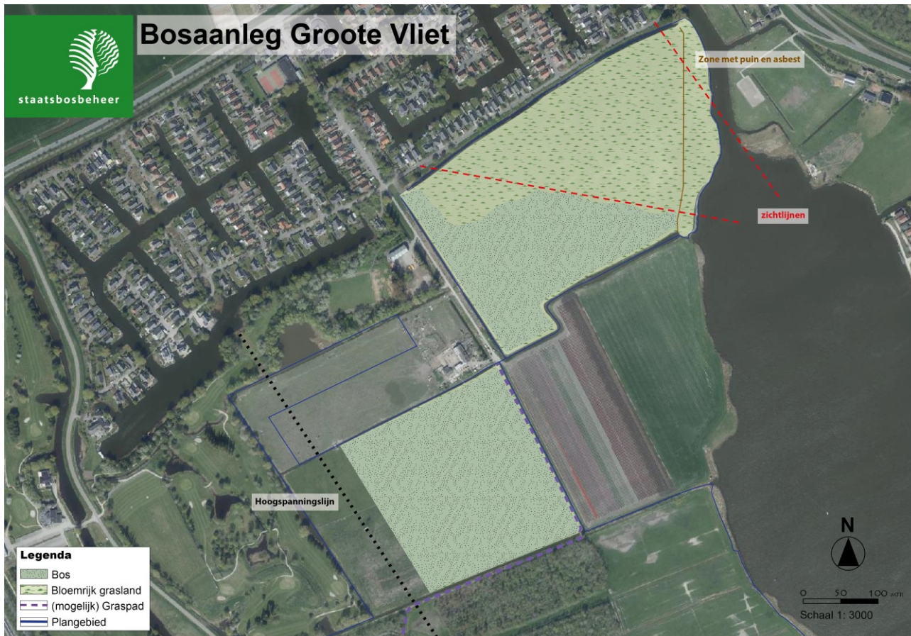
Kaart 1 met aangegeven enkele randvoorwaarden (uitzicht burens, zichtlijn, zone puin en hoogspanningslijn).