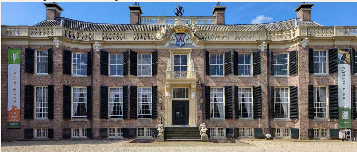
LOCATIE KASTEEL GROENEVELD IN BAARN – EEN INSPIRERENDE PLEK MIDDEN IN DE NATUUR, WAAR RUST EN REFLECTIE ALS VANZELF ONTSTAAN

Dag 2 & 3 – doorbreken van patronen & oefenen: je leert vanuit nieuwe inzichten en bewustzijn hoe je anders kunt communiceren en effectief kunt sturen en creëren waar jij op uit bent in je werk en in je leven!