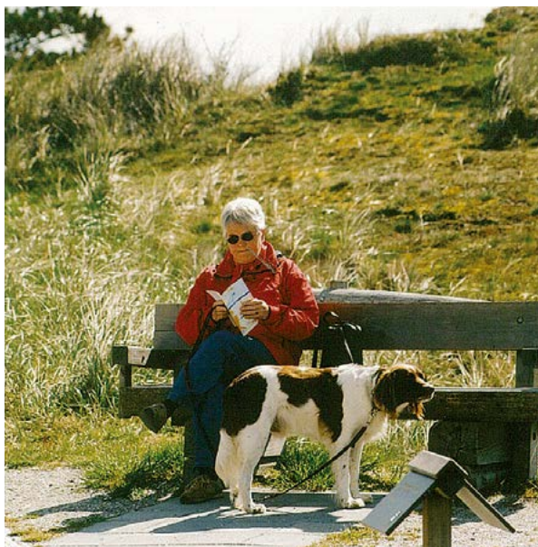
Even zitten lezen in het duin.