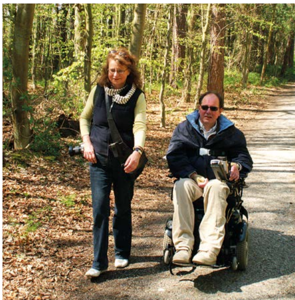
Dennenbos wordt langzaam loofbos.

het groot aantal zonuren is Texel een echt vlinder-eiland, en een van de vlinderrijkste plekken van Nederland. Wanneer u hier even de tijd neemt, kunt u heel wat soorten vlinders zien.