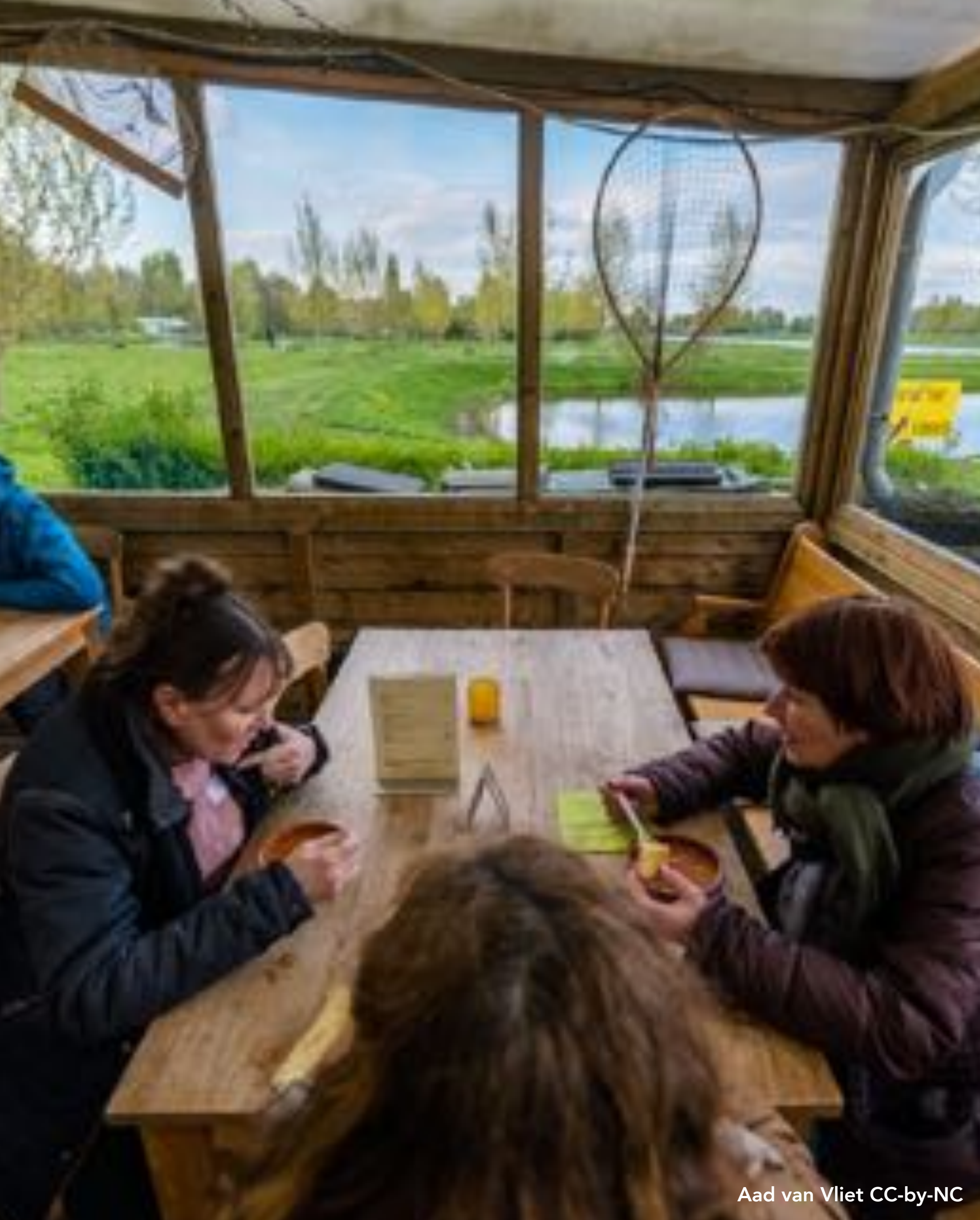
Aad van Vliet CC-by-NC