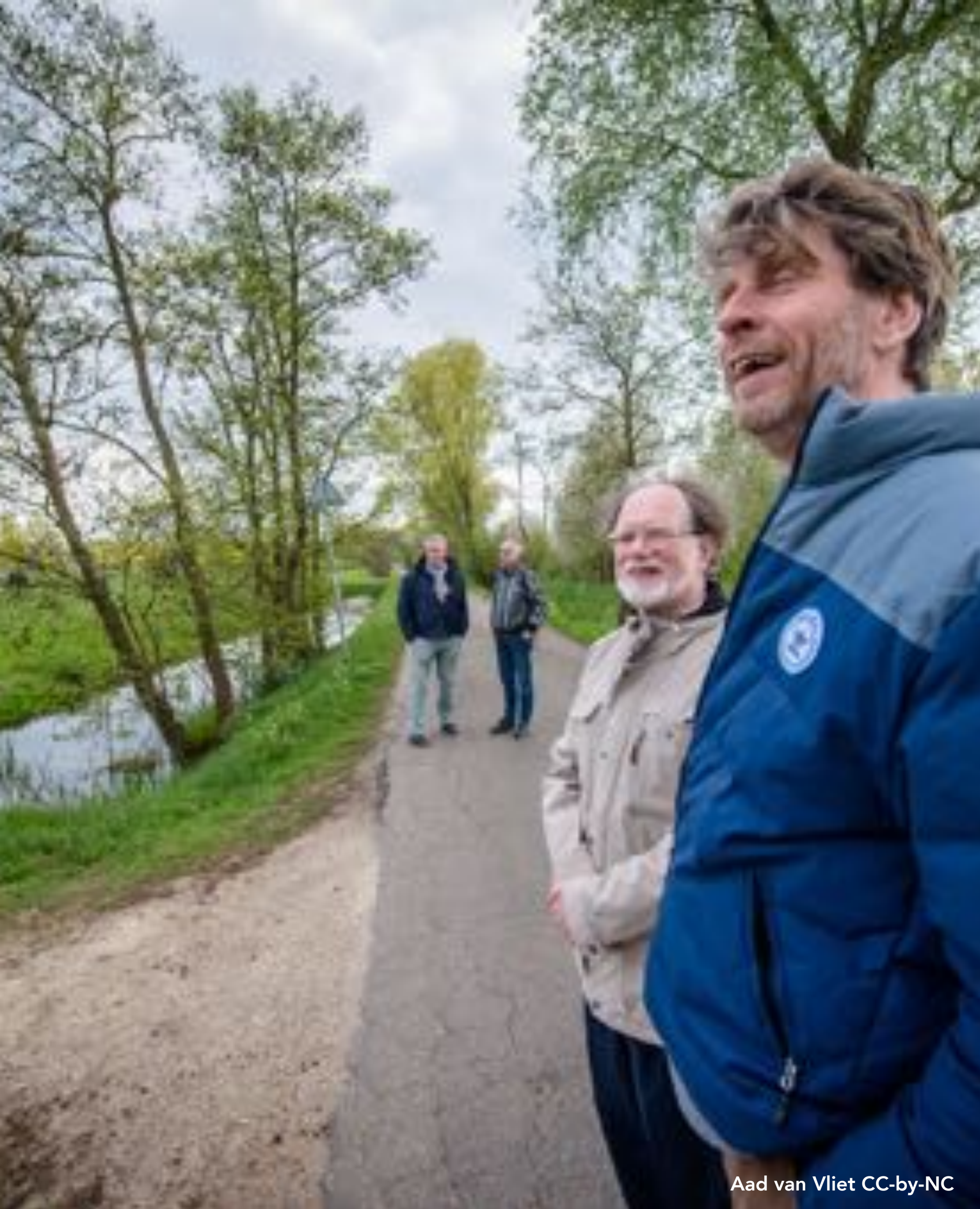
Aad van Vliet CC-by-NC