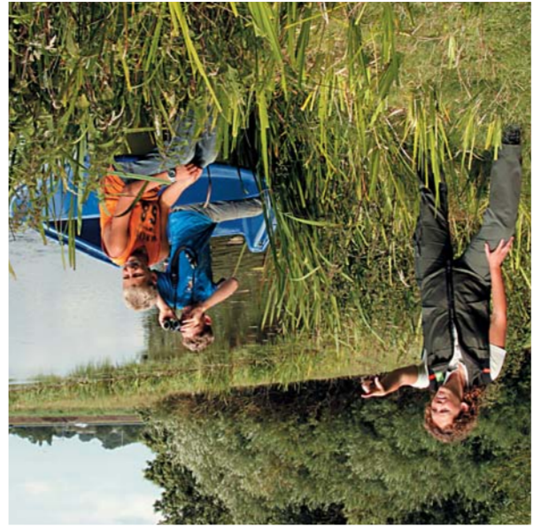
Even kijken welke route we zullen nemen.

Het Groene Hart is wereldberoemd en dat is terecht. De lange, rechte weilanden doorsneden met glinstende sloten, de knotwilgen, rietkragen en molens her en der. Oit was dit Groene Hart èen zompig veenmoeras waar geen mens kon komen. Tot de elfde, twaalfde eeuw toen bisschoppen van Utrecht en de graven van Holland de ontgining in gang lieten zetten. Door het graven van sloten werd het veen ontwaterd zodat het droog genoeg werd om er akkerrijes op aan te leggen. Ontwaterd veen klinkt echter in en wordt daarmee weer natter. Er kwamen molens en het land daalde en daalde. De grond werd te nat om als akker te kunnen gebruiken. Akker werd weiland en de koe verscheen. De weilanden van toen waren