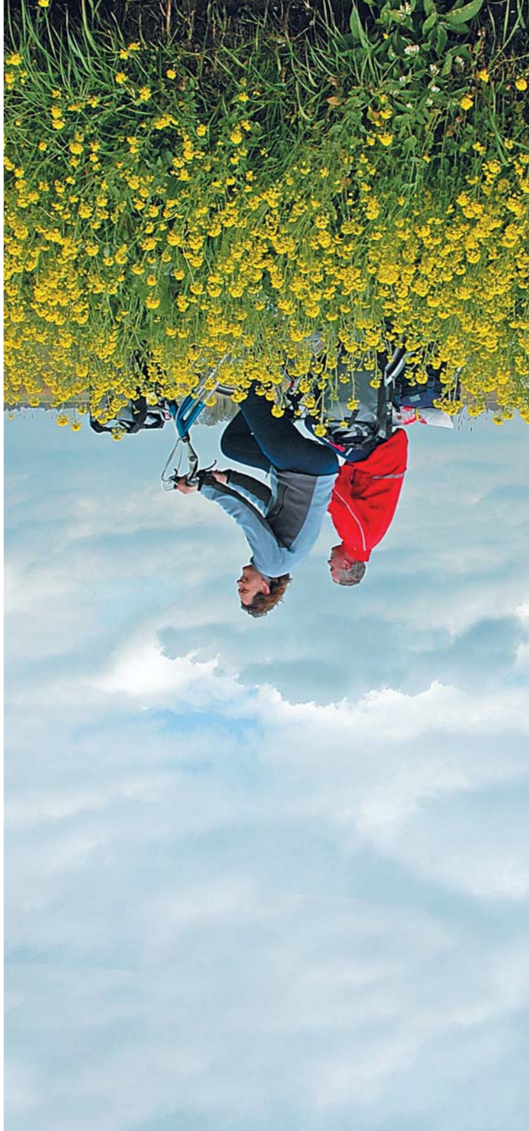
Heerlijk fietsen door het rustige en weidse Groene Hart