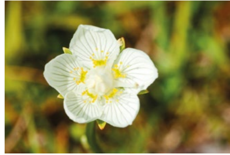
Parnassia komt veelvuldig voor in de Grevelingen.

De Grevelingen is een voormalige zeearm tussen Goeree-Overflakkee en Schouwen-Duiveland. Het is het grootste zoutwatermeer van West-Europa. De slikken en visrijke wateren maken het een belangrijk gebied voor kustbroedvogels. De drooggevallen platen herbergen de grootste populatie groenknolorchis van Nederland en de grasachtige gebieden zijn het leefgebied voor de bijzondere noordse woelmuis. Fjordenpaarden, shetlanders en koeien grazen op de eilanden en de Slikken van Flakkee en de Slikken van Bommende. Ze helpen de vlaktes open te houden. De Grevelingen is ideaal voor een dagje uit. Je kunt er surfen, zeilen, aanmeren