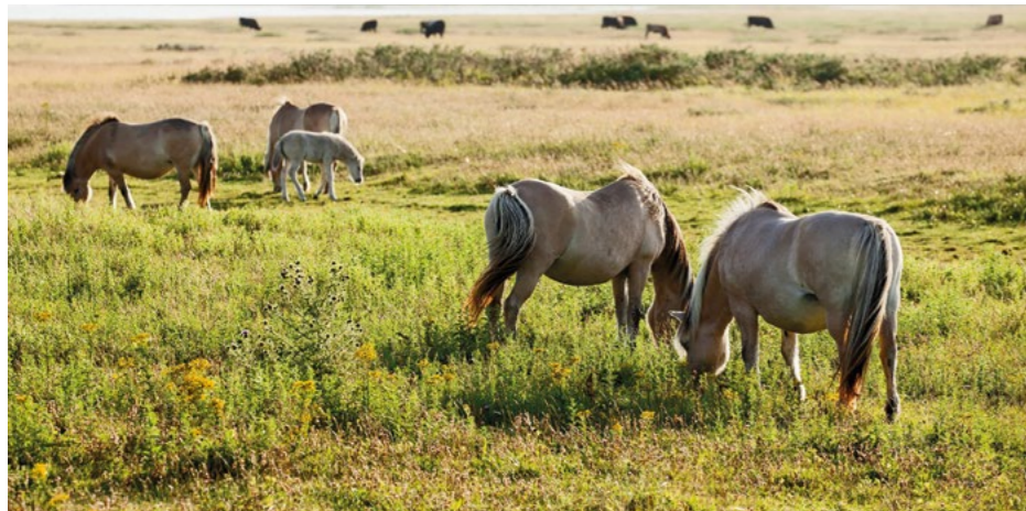
Fjordenpaarden grazen op de Slikken van Flakkee en op eilanden in de Grevelingen.

op één van de bijzondere eilanden of heerlijk fietsen en wandelen. Het is ook een Natura 2000 gebied. Geniet van de natuur zonder deze te verstoren.