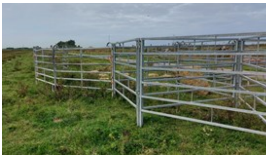
Een kraal wordt gebruikt om dieren veilig en rustig te vangen.

Tijdens de vangacties in het najaar worden ook de aantallen dieren teruggebracht naar het gewenste aantal. Soms betekent dat dat de dieren geslacht worden, maar er vindt ook regelmatig uitwisseling plaats met andere natuurgebieden. In het buitendijkse deel bij de loswal staat al enkele weken een kraal. De Schotse hooglanders die hier liepen, zijn 20 oktober ingevangen, geormerkt en verhuisd naar een nieuw