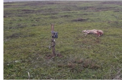
Onderzoek met wildcamera