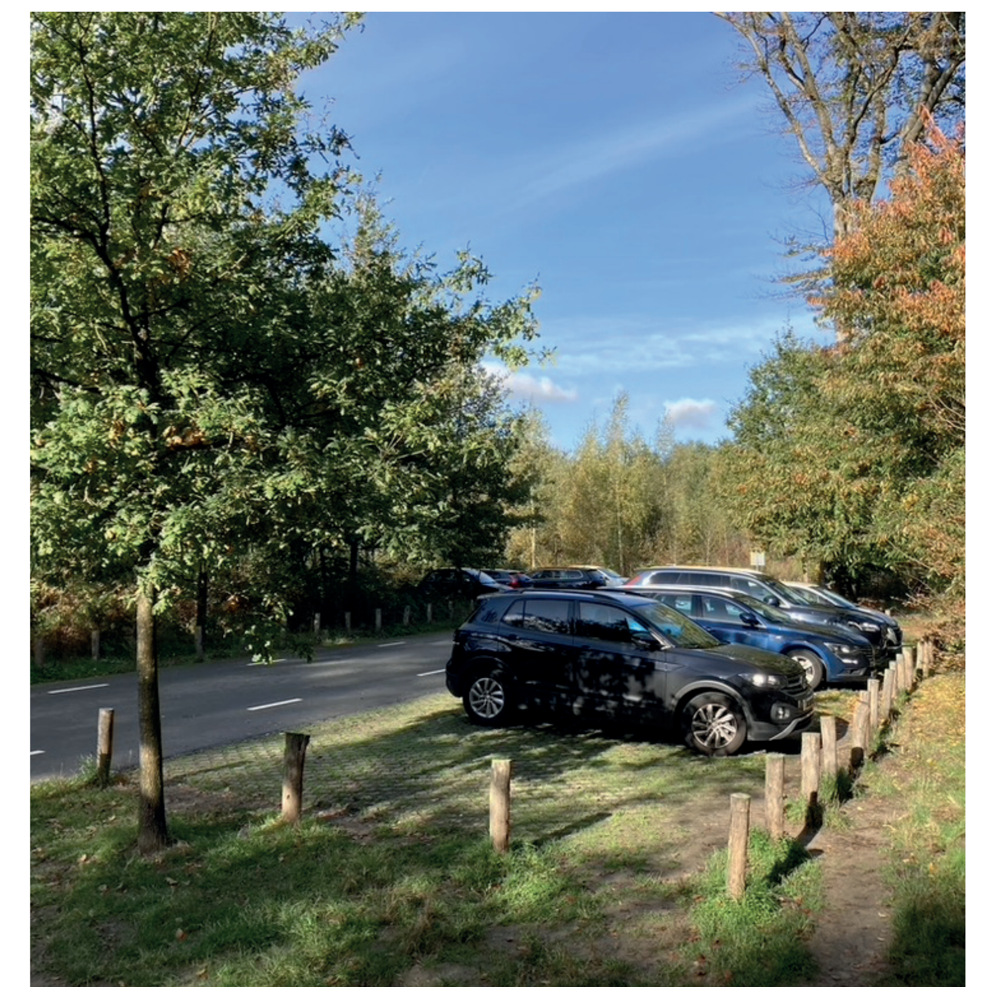
Tijdelijke parkeerplaats Huisdreef

De onderstaande kaart laat zien dat op het drukste meetmoment, de meeste parkeerplaatsen nog veel plek hebben (groen). Kaart met de bezetting van de parkeerplaatsen op het drukste meetmoment (zondag 14 mei 13.00-14.00)