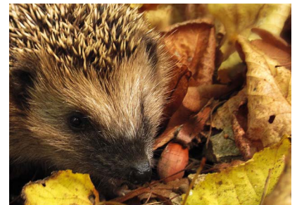
Egel ritselt tussen dorre bladeren.