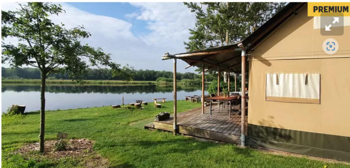
▲ BuitenOverleg aan het Wijchens Ven

Reactie van 5.1 lid 2 sub e Woo op artikel in De Gelderlander