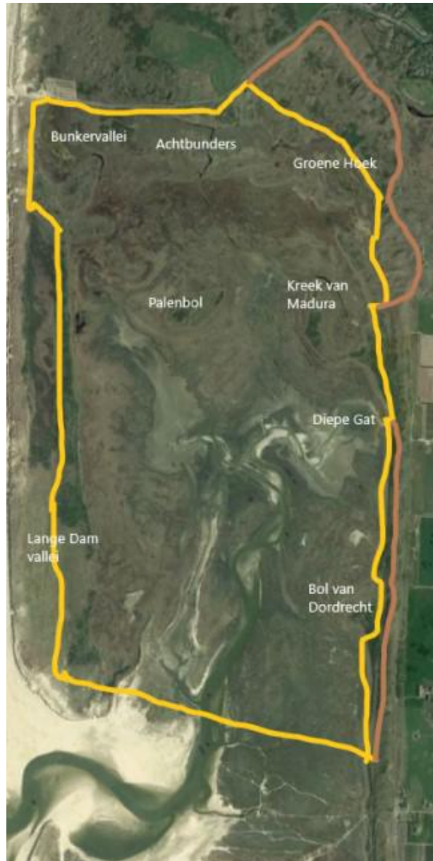
Fig 1: Slufter met huidig (geel) en oud tracée (bruin)

Het leefgebied van de paarden binnen de Slufter is verkleind door plaatsing van twee subrasters. Een van deze loopt vanaf de Krimweg onder de officiële waterkering door en maakt ter hoogte van de Hanenplas een aansluiting op het bestaande raster. Kwetsbare gebieden zoals de Geschoven Hoek en noordhellingen met bijzondere mosvegetaties zijn zo beschermd.