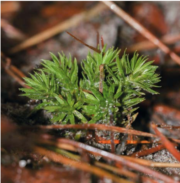
De zeldzame dennenwolfsklauw komt maar op twee plekken in Limburg voor.