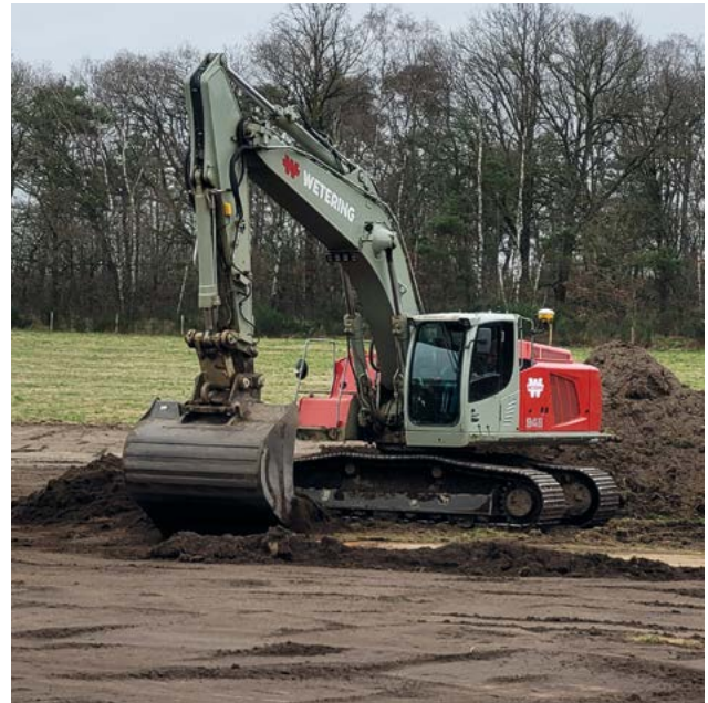
In een deel van het terrein bij het Natura 2000-gebied Meinweg wordt de voedselrijke toplaag van de bodem afgegraven om de ontwikkeling van een schraal graslandtype te creëren. Op deze manier ontstaat er in het terrein een mozaïek van vegetaties van wat rijkere en armere bodems. Dit draagt bij aan de biodiversiteit en de robuustheid van het gebied.

groot gebied een belangrijke grondstof gewonnen. Door de lange duur van de winningsactiviteiten ontstonden naar schatting 2000 tot 4000 mijnen, waarvan er zo'n 75 zijn onderzocht en toegankelijk gemaakt. Vuursteen was het staal van de steentijd. Het materiaal is hard en scherp en zeer goed te gebruiken voor het maken van wapens en gebruiksvoorwerpen zoals pijl- en speerpunten, bijklingen en messen. De mijn is van ongeveer 4200 tot 2650 voor Christus in gebruik gebleven.