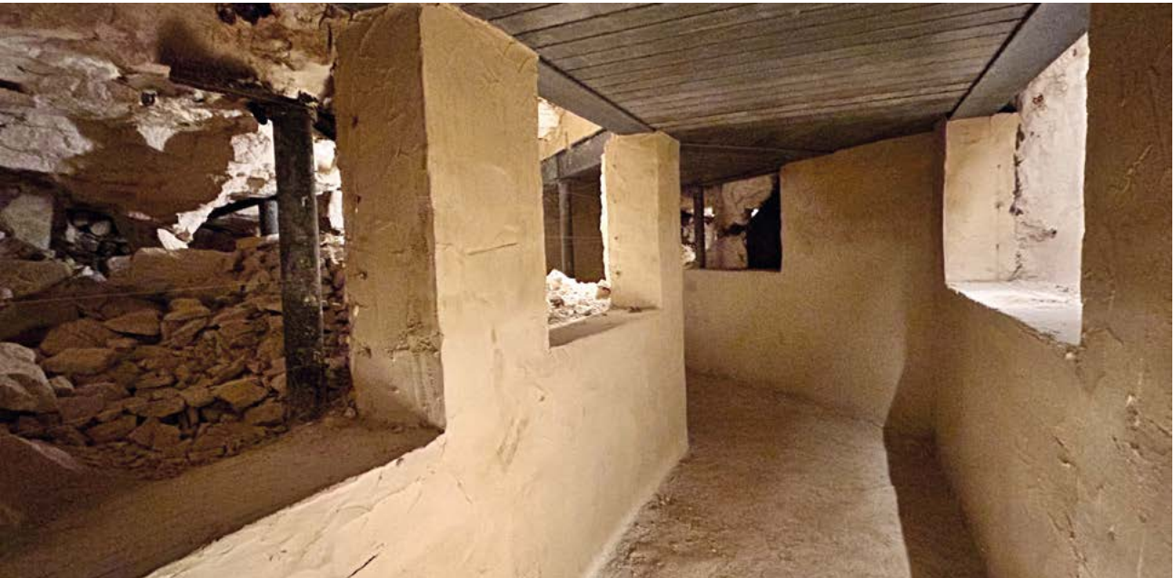
Eén van de vier nieuwe zijgangen met zicht op prehistorische gangenstelsels in de Vuursteenmijn.

keer in de week dennen eruit gaat trekken op de hei zodat deze niet overwoekerd wordt en uit eindelijk verdwijnt.'