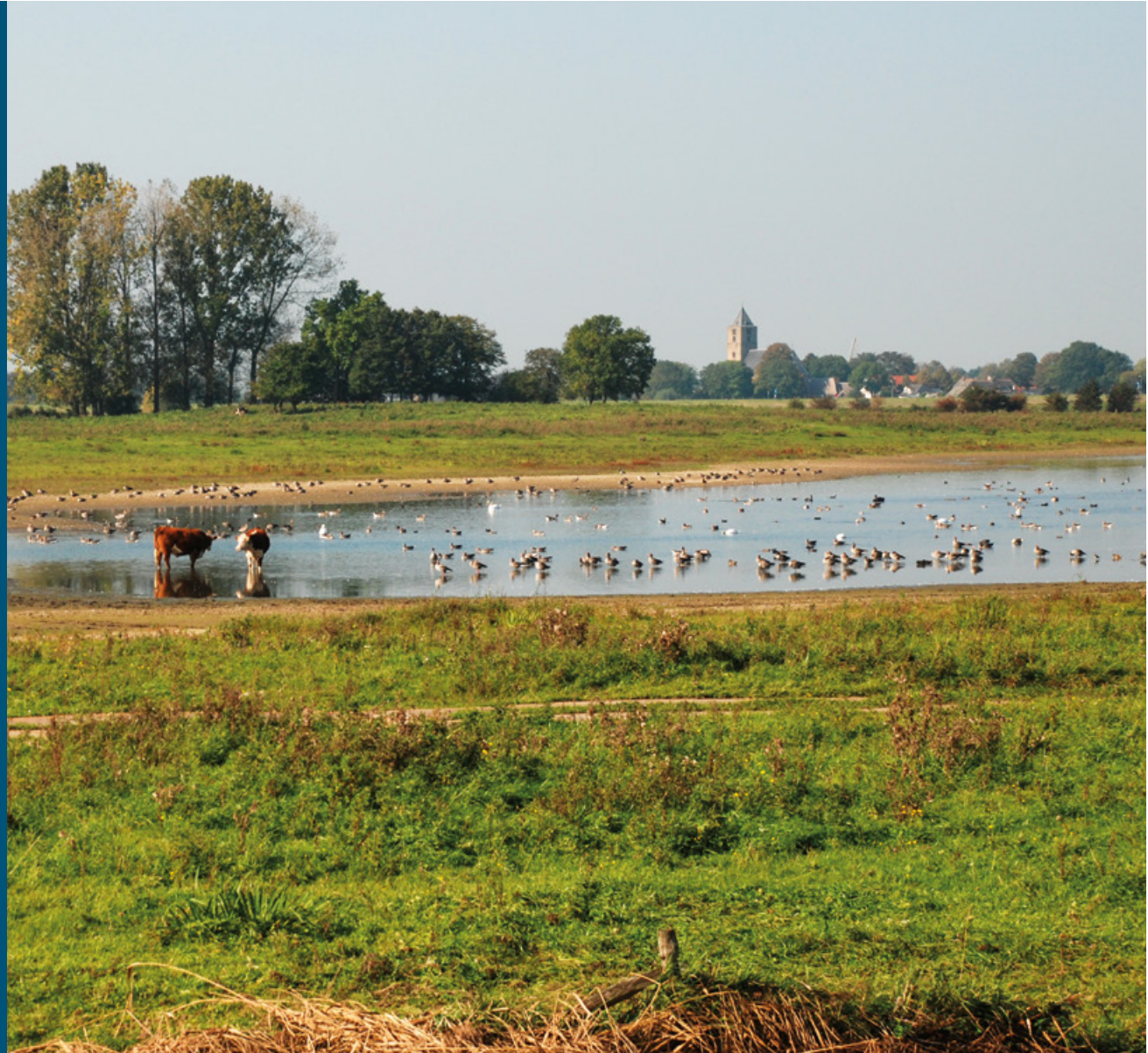
Vreugderijkerwaard met Zalk op de achtergrond | Cobie Uiterwijk

Na de hoogwaters van 1993 en 1995 besloot een boer zijn land in de Vreugderijkerwaard te verkopen en elders een nieuw bedrijf te beginnen. Dat luidde een snelle verandering in: een paar jaar later ging de herinrichting van start. Er kwam een meestromende nevengeul met flauwe oevers, er ontstond moeras en een (niet gepland) ooibos. In het begin - het pionierstadium - broedden er kluten op de zandige oevers. Nu de natuurlijke successie verder is gevorderd, is het een eldorado voor steltlopers die hier tijdens de trek foerageren en uitrusten: grutto's, watersnippen, kemphanen en verschillende soorten ruiters. Tussen de nevengeul en de IJssel ligt een fraaie oeverwal met glanshaverhooiland, begraasd door runderen. De grond die vrijkwam bij de herinrichting bleek tegen de verwachting in niet geschikt voor dijkversterkingen: er zat te veel zand in. Toevallig speelde op dat moment ook de natuurontwikkeling in het Ketelmeer. De aannemer heeft de grond uit de Vreugderijkerwaard benut om daar eilanden aan te leggen. Daar broedt nu een zeearend die af en toe in de Vreugderijkerwaard komt foerageren.