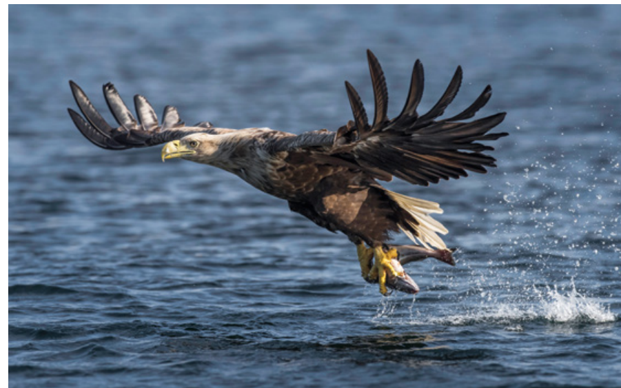
Zeearend met prooi | Bert Ooms