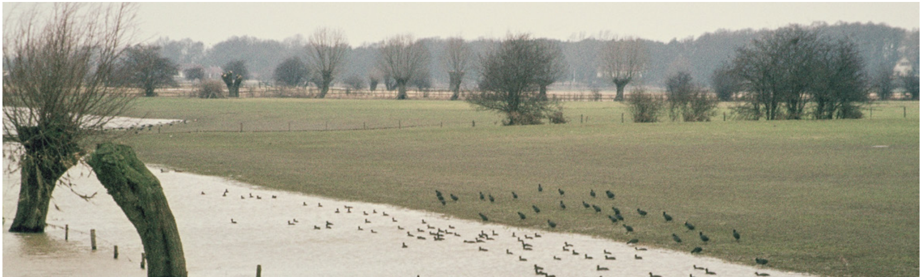
Rivierdijken: hoogwater in de IJssel, kwel binnendijks

Werk aan het rivierengebied is nooit af. Het programma Integraal Riviermanagement verbindt verschillende opgaven op het gebied van waterveiligheid, bevaarbaarheid, zoetwaterbeschikbaarheid, waterkwaliteit, natuur en een (economisch) aantrekkelijke leefomgeving. De transities in de landbouw (natuurinclusieve landbouw, circulaire landbouw) en de stikstofaanpak (Programma Natuur van het ministerie van LNV) kunnen nieuwe kansen voor synergie brengen. Zo wordt het rivierengebied nóg mooier en natuurlijker.