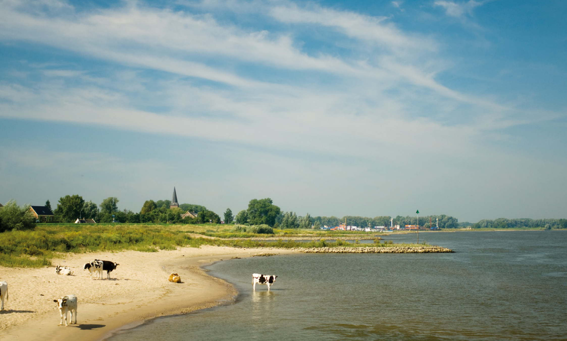
Breemwaard bij Zaltbommel, eerste fase; oude situatie met koeien bij de rivier