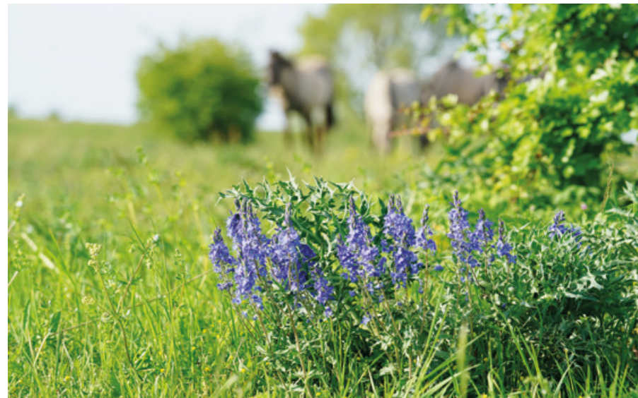
Erlecomse Waard: brede ereprijs en grazende konikpaarden

Een centrale rol is weggelegd voor het programma Integraal Riviermanagement. Dit programma verbindt verschillende opgaven op het gebied van waterveiligheid, bevaarbaarheid, zoetwaterbeschikbaarheid, waterkwaliteit, natuur en een (economisch) aantrekkelijke leefomgeving. Bekende combinaties - met dijkversterkingen, rivierverruiming en verantwoorde delfstoffenwinning - blijven goede kansen bieden. De transities in de landbouw (natuurinclusieve landbouw, circulaire landbouw) en de stikstofaanpak (Programma Natuur van het ministerie van LNV) kunnen nieuwe kansen voor synergie brengen.