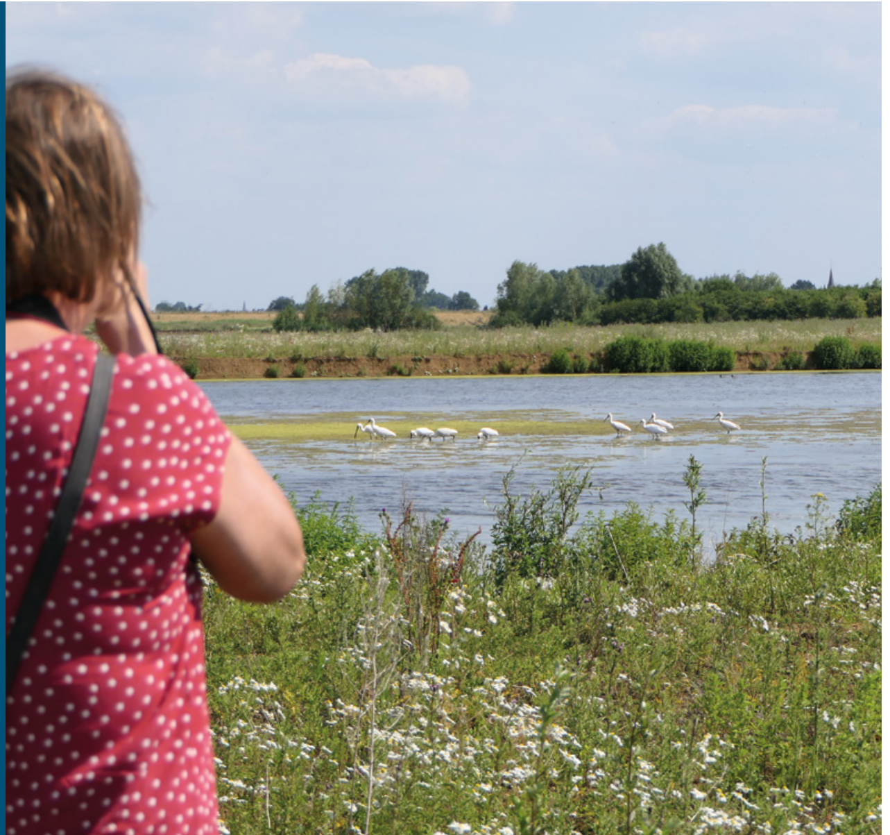
Hemelrijkse Waard, Oijen met uitzicht over de landinwaartsstromende beek met foeragerende lepelaars

Tien jaar geleden bestond deze Maasúiterwaard nog grotendeels uit maisakkers. In 2013 ging de herinrichting van start, voornamelijk via kleiwinning. Het resultaat is een weelderig natuurgebied, met een stromende nevengeul, geïsoleerde strangen, een groot moeras, oeverruigtes en jong zachthoutoobos. Al snel na de oplevering groeiden er allerlei planten, waaronder bruin cypergras, fraai duizendguldenkruid, waterpostelein en zwarte els. Het moeras trekt veel libellen aan, zoals de zwervende heidelibel en de zadellibel. Ook herbergt het gebied een indrukwekkend aantal eenden, visdiefjes, lepelaars en andere watervogels. Een aantal karakteristieke 'bakenbomen', die langs de hele Maas staan, moest wijken voor de nevengeul. Samen met omwonenden is een mooie nieuwe bestemming bedacht. De enorme bomen liggen nu als dood hout in de waterpartijen, wat allerlei waterleven aantrekt: paaiende vissen, jonge visjes die een schuilplaats zoeken, schelpjes, enzovoort. Dat is weer heerlijk voedsel voor de watervogels. En de bezoekers mogen te midden van dit alles vrij rondstruinen.