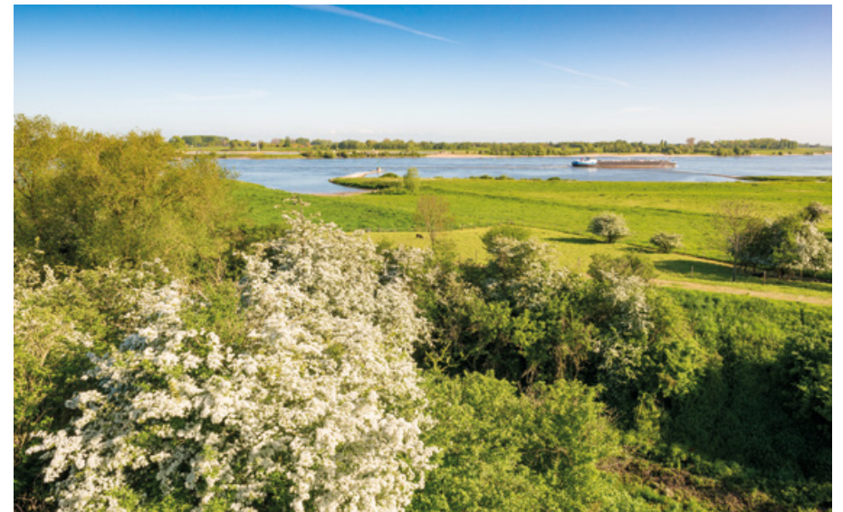
Uiterwaarden langs de Waal bij Fort Sint Andries

Ook op regionaal niveau ontstonden nieuwe initiatieven. Een voorbeeld is Waalweelde, een integraal plan voor het gebied rond de Waal tussen Pannerden en Loevestein. Onder regie van de provincie maakten regionale overheden, bedrijven en natuurorganisaties hier samen ideeën voor nieuwe bedrijvigheid, aantrekkelijke woongebieden, een mooie leefomgeving en nieuwe natuur. Niet alle ambities zijn uiteindelijk werkelijkheid geworden, maar het is wel gelukt een impuls te geven aan NURG-projecten langs de Waal die zonder deze steun waarschijnlijk niet tot stand waren gekomen.