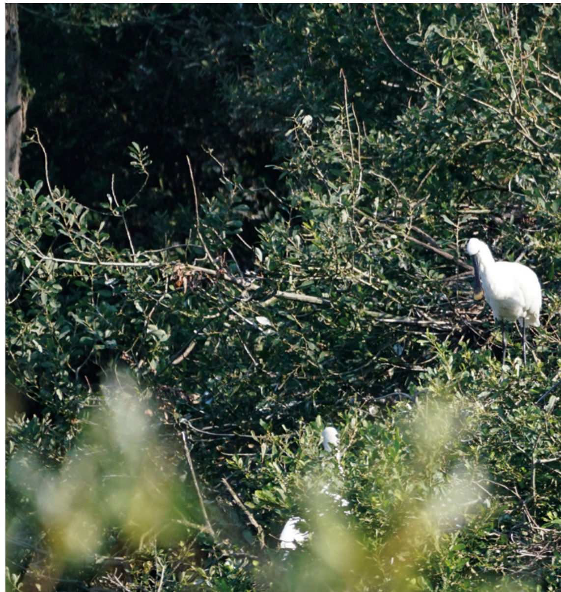
Blauwe Kamer, Iepelaarskolonie in ooibos