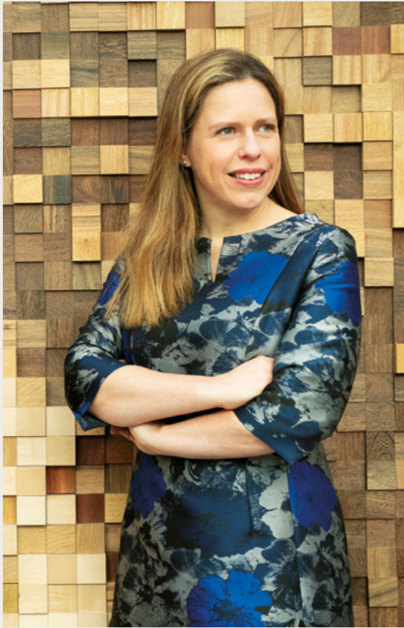
Carola Schouten, Minister van Landbouw, Natuur en Voedselkwaliteit | Rijksoverheid