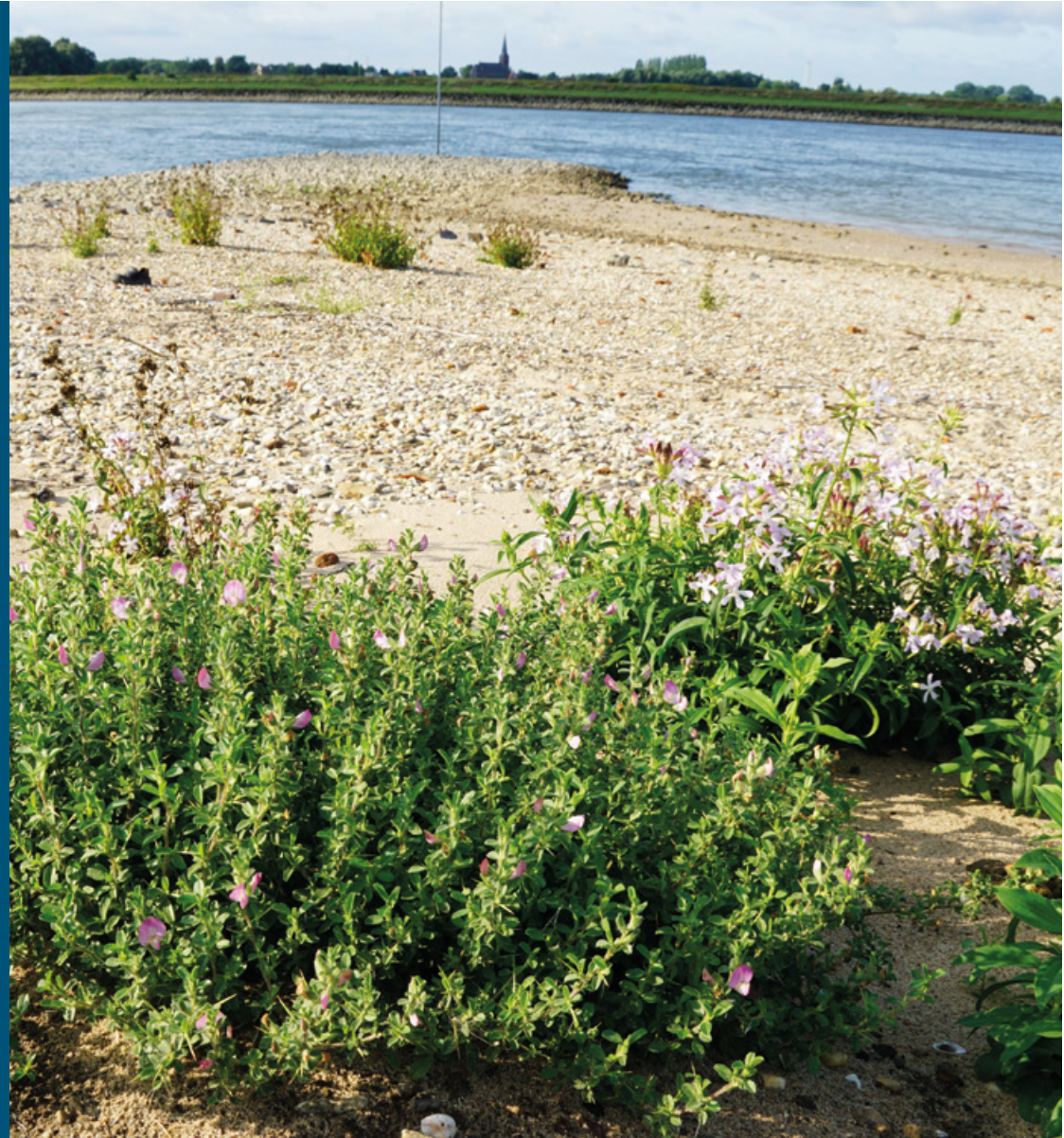
Stroomdalflora (kattendoorn) op zandige oever

Waar vandaag een zandige rivieroever ligt, met een woestijnachtig klimaat waarin pioniersoorten groeien, kolkt volgende week misschien wel rivierwater. Op tientallen plaatsen liggen nevengeulen in de uiterwaarden, klaar om mee te stromen met hoogwater. Of, zoals op sommige plekken, ook bij gemiddelde waterafvoer - als riviertjes in het klein. Ze vormen een veilige haven voor riviervissen: hier vinden ze rustige, ondiepe paaigebieden die in de drukbevaren hoofdgeul verdwenen zijn. Bij hoogwater stroomt de hele uiterwaard geleidelijk onder water. Zelfs de ooibossen dicht bij de dijk staan soms met hun voeten in het water. Als het water weer zakt, blijven kale, slijkkige plekken achter. Al snel steken daar pioniers als klein vlooienkruid en slijkgroen de kop op. Op zandige oevers kiemen bijzondere stroomdalplanten als cipreswolfsmelk en kattendoorn. Door dit soort dynamische omstandigheden terug te brengen, is de natuur van de rivier weer opgebloeid.