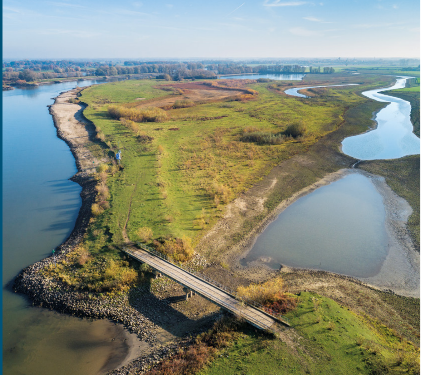
Welsumer en Fortmonderwaarden: ingerichte waterberging

In deze uiterwaarden langs de IJssel is de natuur er flink op vooruitgegaan door twee nevengeulen aan te leggen. Ook is landbouwgrond veranderd in kruidenrijk en faunairijk grasland met natuurlijke begrazing. In de nieuwe natuur komen typische waterminnende soorten voor, zoals de grote en kleine modderkruiper en de rivierdonderpad. Samen met de naastgelegen Duursche Waarden vormen deze uiterwaarden een robuust natuurgebied. Ook recreanten profiteren: er zijn wandel- en fietsroutes, een brug om een 'rondje' te maken, een vissteiger en een informatiecentrum. Een plaatselijke ondernemer exploiteert het restaurant in het informatiecentrum. Het project draagt bovendien bij aan de waterveiligheid: bij hoogwater treedt een waterstandsval van 6-8 cm op.