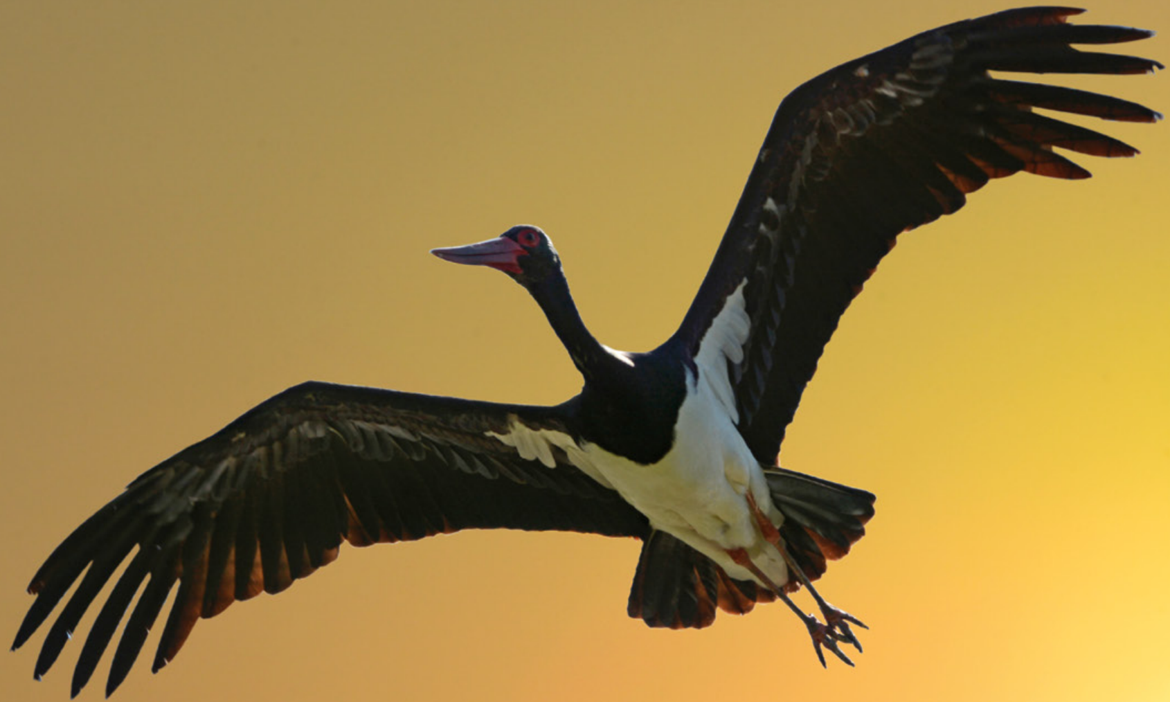
Zwarte ooievaar