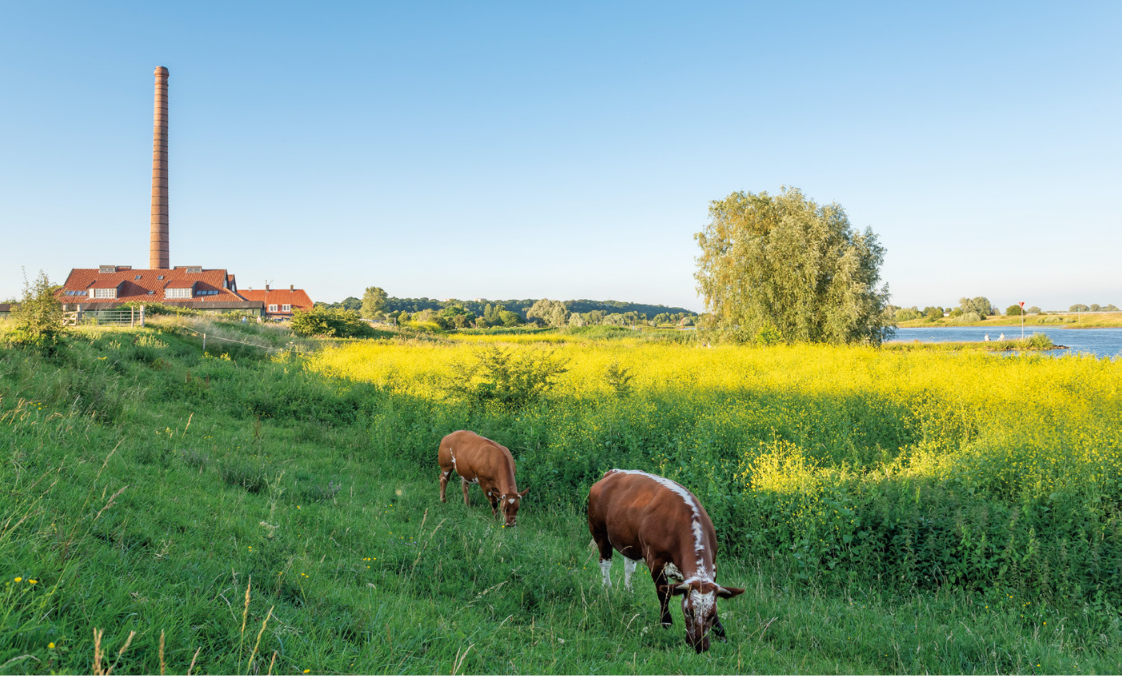
Begrazing in de uiterwaarden bij de oude steenfabriek langs de Nederrijn bij Wageningen