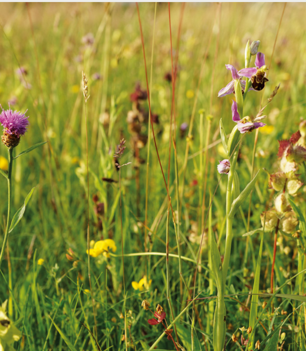
Stroomdalgraslanden: bijenorchis