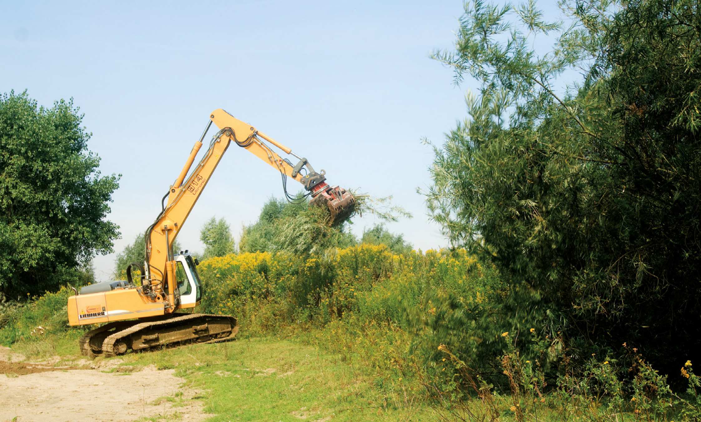
Gamerensche Waarden bij Zaltbommel, tweede fase; bomen rooien voor Ruimte voor de Rivier