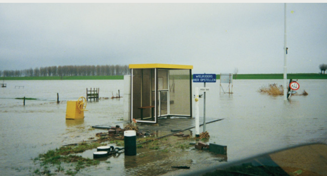
Rivierdijken, hoogwater in de Maas bij Waalwijk, veer naar Drongelen, 1993