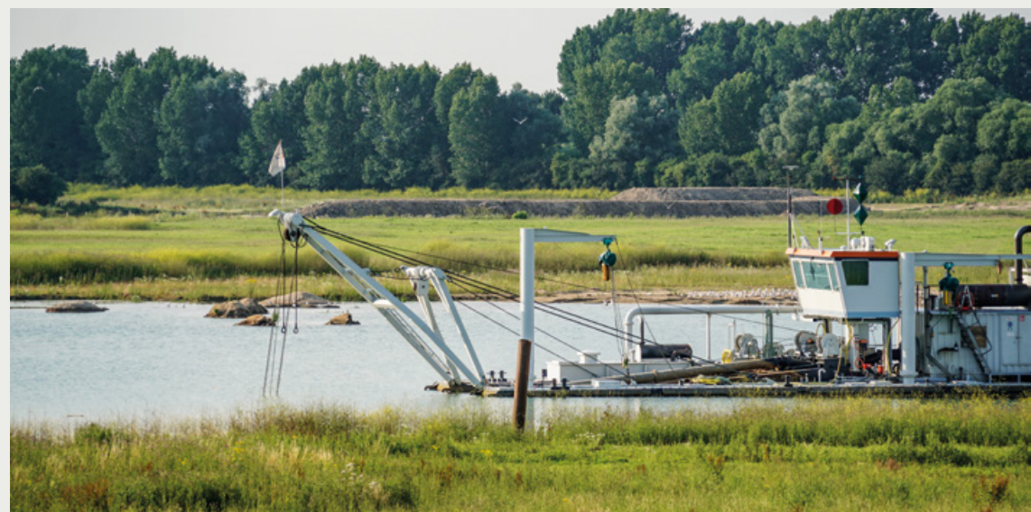
Millingerwaard, Waal: delfstoffenwinning met op de achtergrond konikpaarden | Niels van Tongerlo