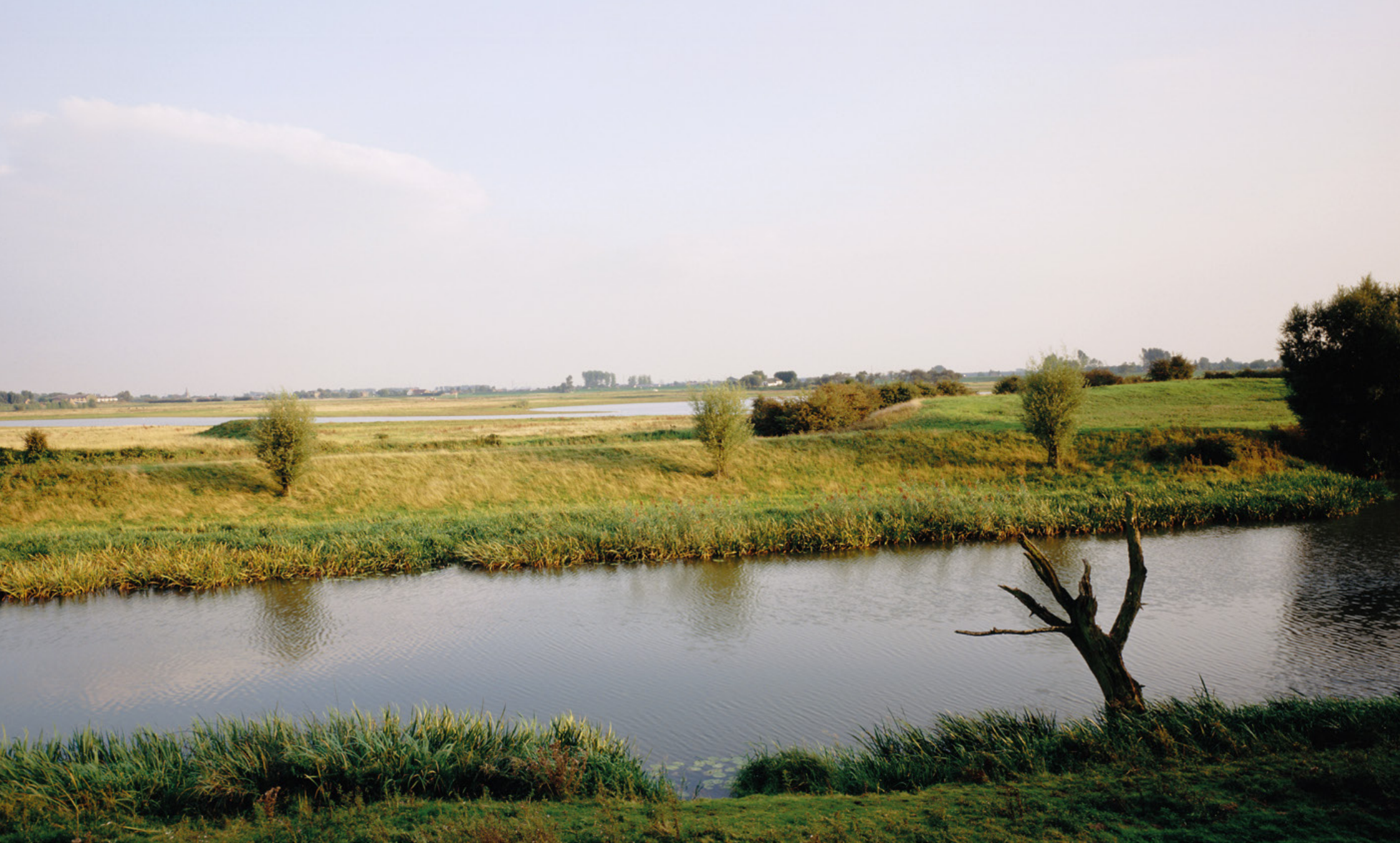
Rivier-oeverreservaat De Blauwe Kamer bij Rhenen: doorgestoken dijk maakt nieuw nat landschap mogelijk