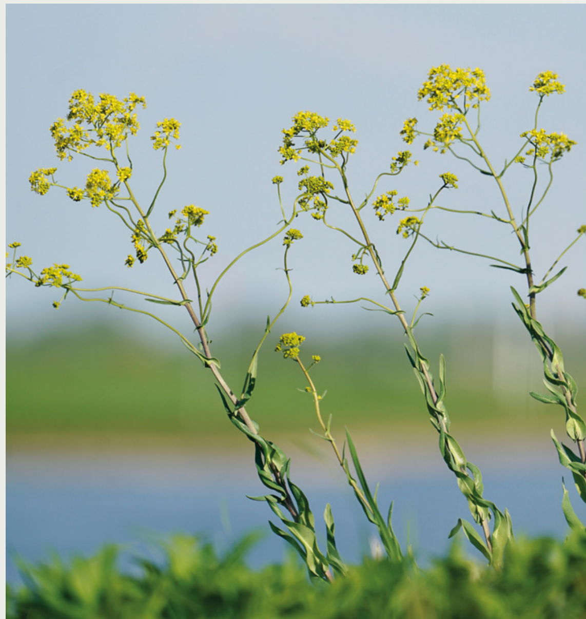
Stroomdalflora: wede in de Klompenwaard