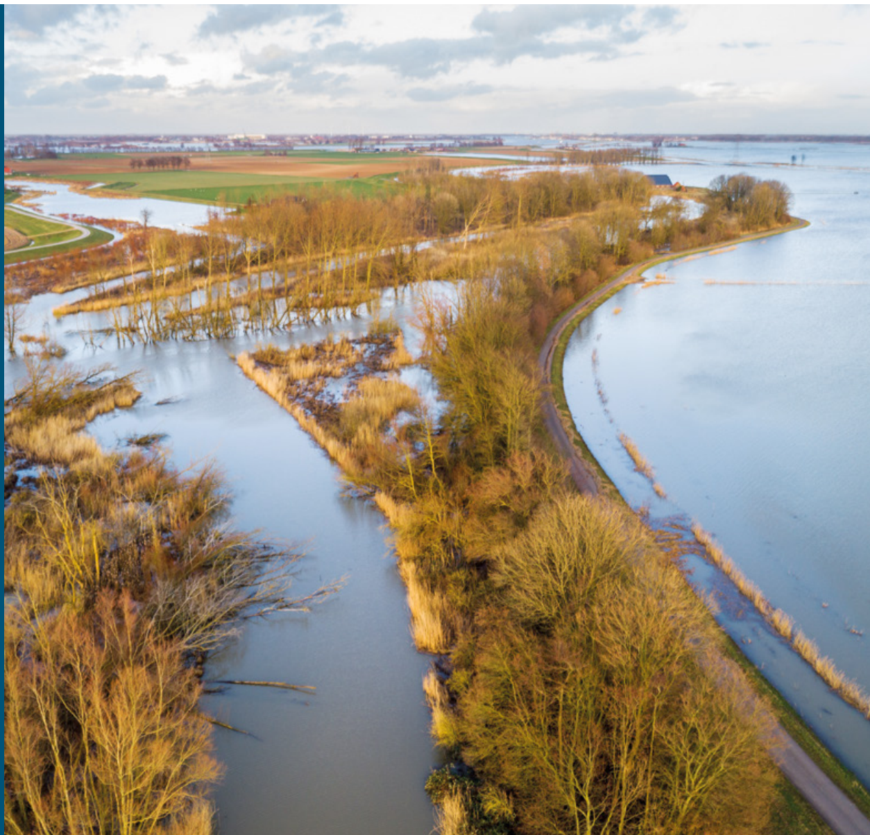
Noordwaard, Merwede: storm en springtij veroorzaken hoge waterstanden, Noordwaard staat voor het eerst onder water

Anders dan de naam suggereert is de Kleine Noordwaard een flink gebied van 500 hectare. In 2006 veranderden akkers met suikerbieten in een waterrijk gebied met enorme kreken. Tweemaal per dag vallen uitgestrekte slikken droog bij laagwater. Bij hoogwater stromen ze geleidelijk weer vol. Vissen als houting, zeetong, harder en zalm gebruiken de kreken als paai- en opgroei gebied. Het is een eldorado voor overnachtende ganzen en eenden, met onder meer grote aantallen krakeenden, smienten en slobbeenden. Op het eiland in de kreken broeden meeuwen, visdiefjes en de grootste klutenkolonie van Nederland. Aan de rand van de Kleine Noordwaard, tegen de 'oude' Biesbosch aan, werd in 2012 het eerste broedpaar van de zeearend sinds tijden gesignaleerd en sindsdien behoort de 'vliegende deur' hier tot de vaste broedvogels. Dagelijks komen natuurliefhebbers uit binnen- en buitenland van deze vogelrijkdom genieten. Recreanten kunnen overnachten op een natuurcamping in het gebied en een bezoek brengen aan het Biesboschmuseum. Bij hoge waterstanden kan het gebied veel rivierwater bergen, wat de veiligheid van Gorinchem aanzienlijk heeft vergroot. De klei die uit de kreken is gegraven, is benut voor dijkversterkingen.