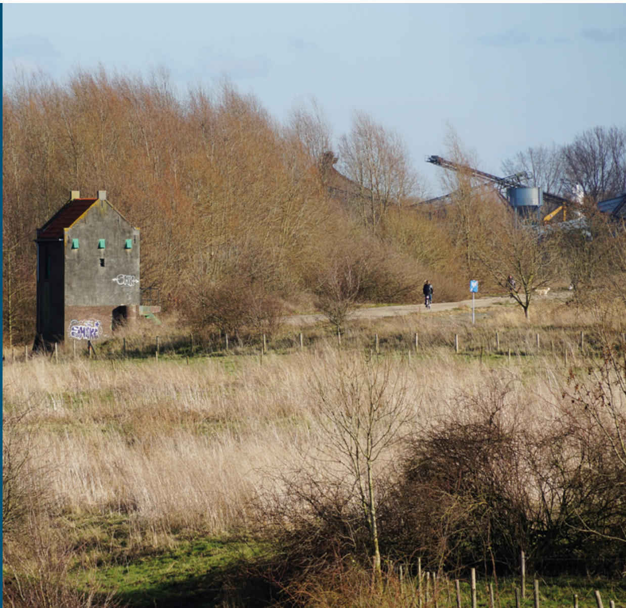
Bemmelse Waard (Waal): defensiedijk met cultuurhistorisch pomphuisje en delfstofwinning (rechts)

De inrichting van dit gebied is in samenwerking met delfstoffenwinners tot stand gekomen. De zandwinning heeft zoveel extra ruimte voor de rivier opgeleverd dat er oerbos tot ontwikkeling kan komen. De herinrichting voor rivierverruiming is inmiddels klaar; er wordt nog gewerkt aan verdere optimalisatie voor de natuur. Bij de werkzaamheden hebben de archeologische waarden speciale aandacht gekregen. Zo is de kolk die in 1799 achterbleef na een verwoestende dijkdoorbraak (waarbij het dorp Doornik door het water werd verzwoegen) intact gebleven. In het gebied liggen verschillende onderdelen van de IJssellinie (een defensiewerk uit de Koude Oorlog), zoals de Defensiedijk en kazematten. Deze zijn als onderdeel van het project beter zichtbaar en beleefbaar gemaakt, in samenspraak met de lokale historische vereniging. Staatsbosbeheer en Rijkswaterstaat hebben het prikkeldraad rond hun eigen terreinen verwijderd. Het gezamenlijke gebied is toegankelijk voor bezoekers die hier ook buiten de paden mogen struinen. Bijzonder onderdeel van de natuur zijn het grote en relatief oude zachthoutoebos en de rivierduintjes waar brede ereprijs en zandweegbree groeien. Op een warme zomeravond is hier de boomkrekel te horen.