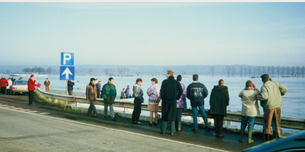
Rivierdijken, hoogwater in de Maas bij Cuijk, 1993