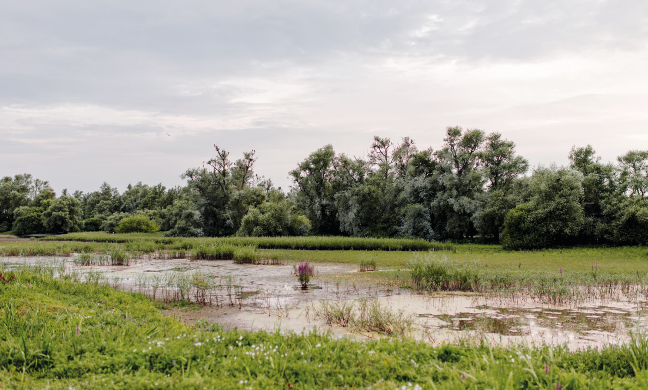
Overstromingsgraslanden in Hengforderwaarden, Olst-Wijhe