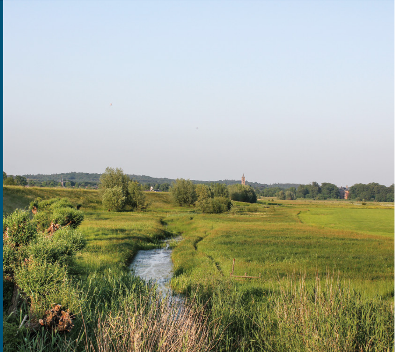
Amerongse Bovenpolder met Amerongen op de achtergrond

Hier, aan de voet van de Utrechtse Heuvelrug, borrelt schoon kwelwater naar boven. Die bijzondere situatie was de sleutel om heel eigen riviernatuur tot ontwikkeling te laten komen. Door de bovenste bodemlaag weg te graven zijn uitgestrekte kwelmoerassen en een rivierkwelgeul ontstaan. De afgegraven klei is verkocht aan de nabijgelegen steenfabriek en gebruikt voor dijkversterking. Dat leverde een flinke besparing op. Rijkswaterstaat zag kansen voor de Kaderrichtlijn Water en betaalde mee aan de aanleg van de zes kilometer lange kwelgeul, zes hectare paaiplaatsen en een verbinding met de Nederrijn via een vistrap. Ook de provincie Utrecht leverde een financiële bijdrage. In het waterrijke gebied leven nu moerasvogels (zoals waterral, sprinkhaanzanger en baardmannetje), vissen die van stilstaand of langzaam stromend water houden (zoals alver en winde), verschillende amfibieën en de ringslang en de bever bouwen er burchten.