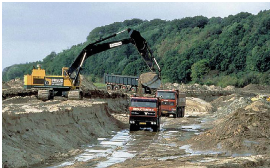
Grondverzet Blauwe Kamer

De twee uitvoerende diensten van de ministeries nemen de uitvoering ter hand: Dienst Landelijk Gebied en Rijkswaterstaat. Na de opheffing van Dienst Landelijk Gebied in 2015 neemt Staatsbosbeheer de taak over. De nieuwe riviergebonden natuur is voor het eerst te zien in de Blauwe Kamer (Nederrijn) en de Duursche Waarden (IJssel).