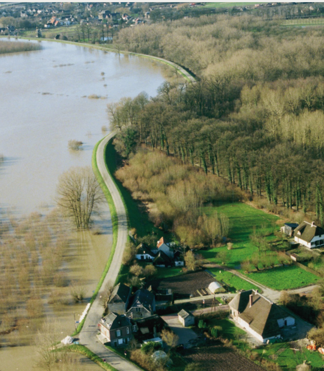
Rivierdijken: hoogwater in de Waal bij Neerijnen, 1995