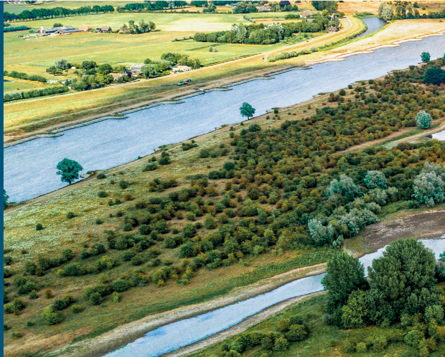
Ooibos en nevengeulen van de IJssel in Duursche Waarden bij Fortmond | Niels van Tongerlo

In de Duursche Waarden langs de IJssel ging de schop al in de grond voordat de NURG-overeenkomst getekend was. De inrichting, gebaseerd op Plan Ooievaar, werd het voorbeeld voor volgende NURG-projecten. De ontwerpers gaven in het veld aanwijzingen waar de delfstoffenwinner mocht graven. Zo ontstond een nieuwe geul die bestaande zandwinputten met elkaar verbond. Door ook de zomerdijk af te graven, kwam de geul in contact met de rivier te staan. Binnen zes weken was de inrichting klaar, gefinancierd door zandwinning. De nieuwe riviernatuur was al snel zichtbaar, met moeras, ruigtes en hardhoutoobos. Er leven nu bevers en otters, aalscholvers, reigers en lepelaars, in de geul zwemt onder meer de grote modderkruiper. Er komt regelmatig een zeearend foerageren en de steenfabriek blijkt een prima broedplek voor slechtvalken. Het gebied vormt bovendien een robuust geheel met de Fortmonder Waarden, waar in de uiterwaardvergraving 'Welsumerwaarden en Fortmonderwaarden' werd gewerkt aan verlaging van het waterpeil met zes tot acht centimeter. Dit werd later ook in het kader van NURG ingericht.