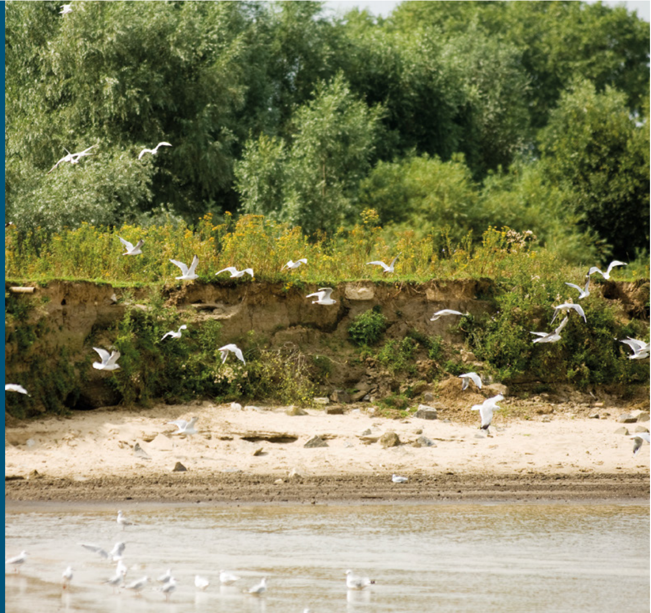
Gamerensche Waarden bij Zaltbommel, tweede fase; oeverkanten

Toen eind jaren negentig de Deltawet Grote Rivieren van kracht werd, om in hoog tempo de rivierdijken te versterken, kwam de inrichting van de Gamerensche Waarden en de Breemwaard in een stroomversnelling. Uiterwaardverlaging in de Gamerensche Waarden kon de benodigde extra ruimte bieden die nodig was om een nieuwe winterdijk in de uiterwaard te bouwen. Om die reden is dit gebied kort na de ondertekening van de NURG-overeenkomst aan de NURG-gebieden toegevoegd. De natuur heeft hier een hoog-dynamisch karakter gekregen. In de drie geulen leven stroominnende vissen als barbeel, winde en snoekbaars. Er groeien pioniers als slijkgroen en stekelnootje. Ook libellensoorten als rivierrombout en weidebeekjuffer houden van de hoge dynamiek. In de Breemwaard was natuurontwikkeling goed te combineren met kleiwinning voor de dijkversterking langs deze waard. Dat heeft een lange strang opgeleverd. Hier overheerst laag-dynamische natuur. De fonteinkruiden in de strang zijn een veilige omgeving voor larven van de grote keizerlibel en heidelibellen.