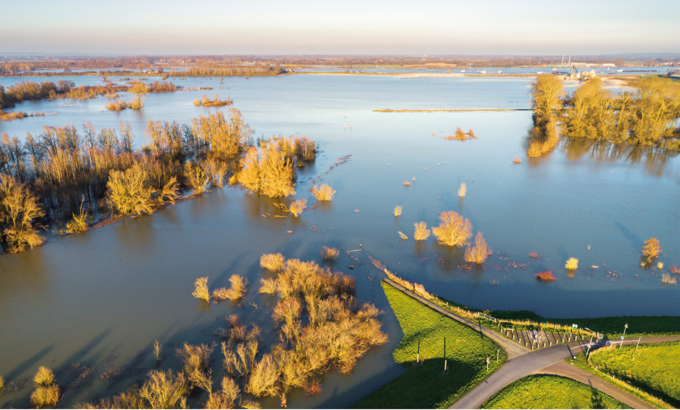
De Waal treedt buiten zijn oevers in de Millingerwaard