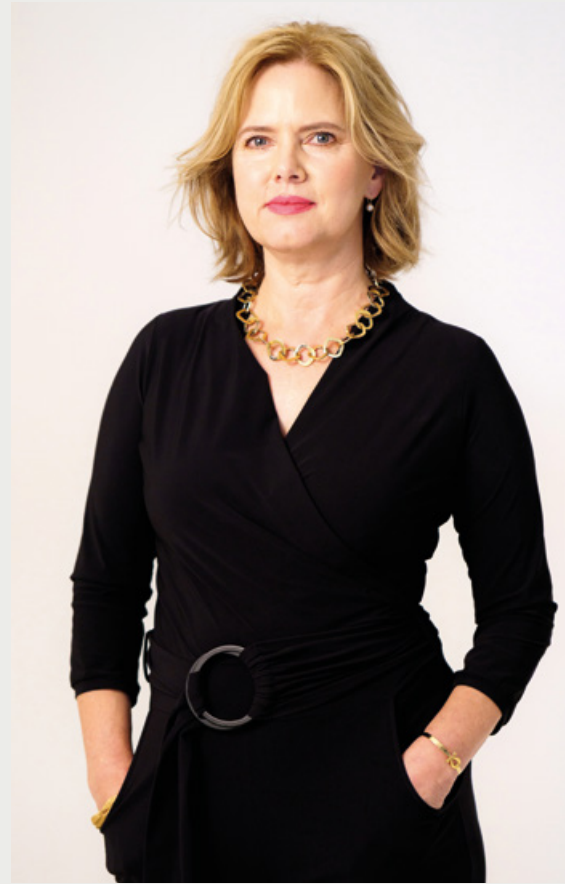
Cora van Nieuwenhuizen, Minister van Infrastructuur en Waterstaat | Rijksoverheid