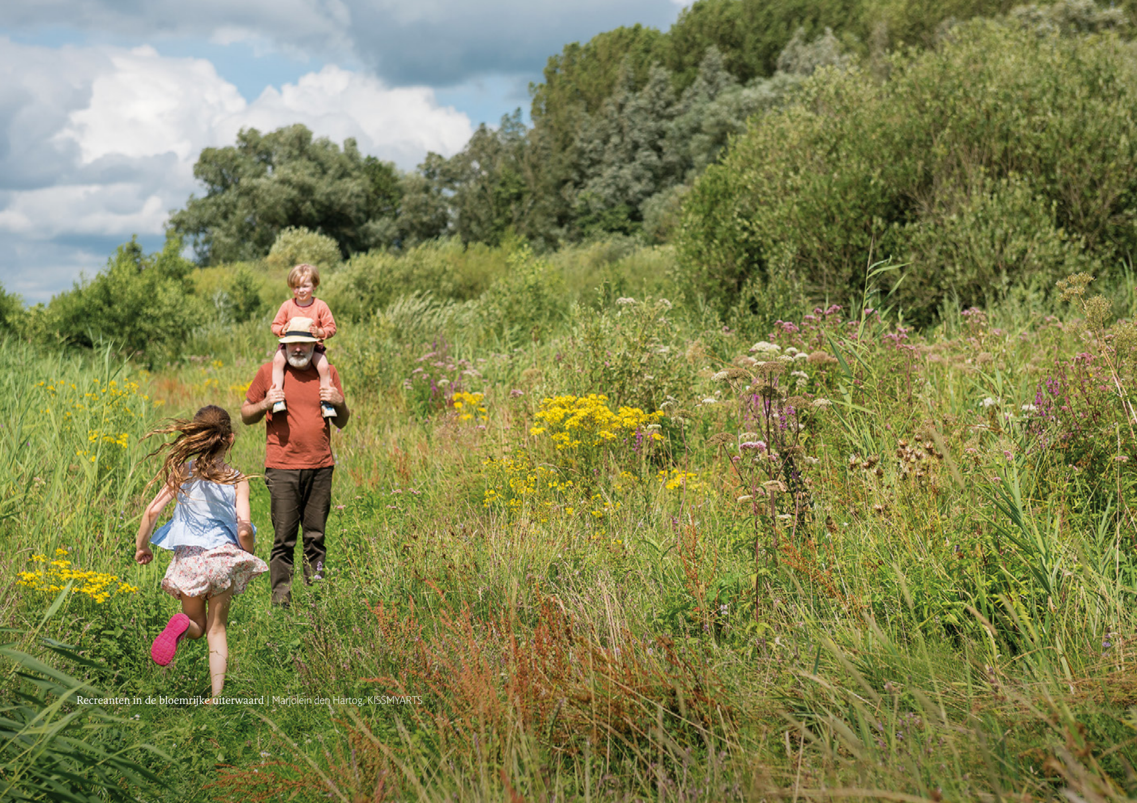
Recreanten in de bloemrijke uiterwaard