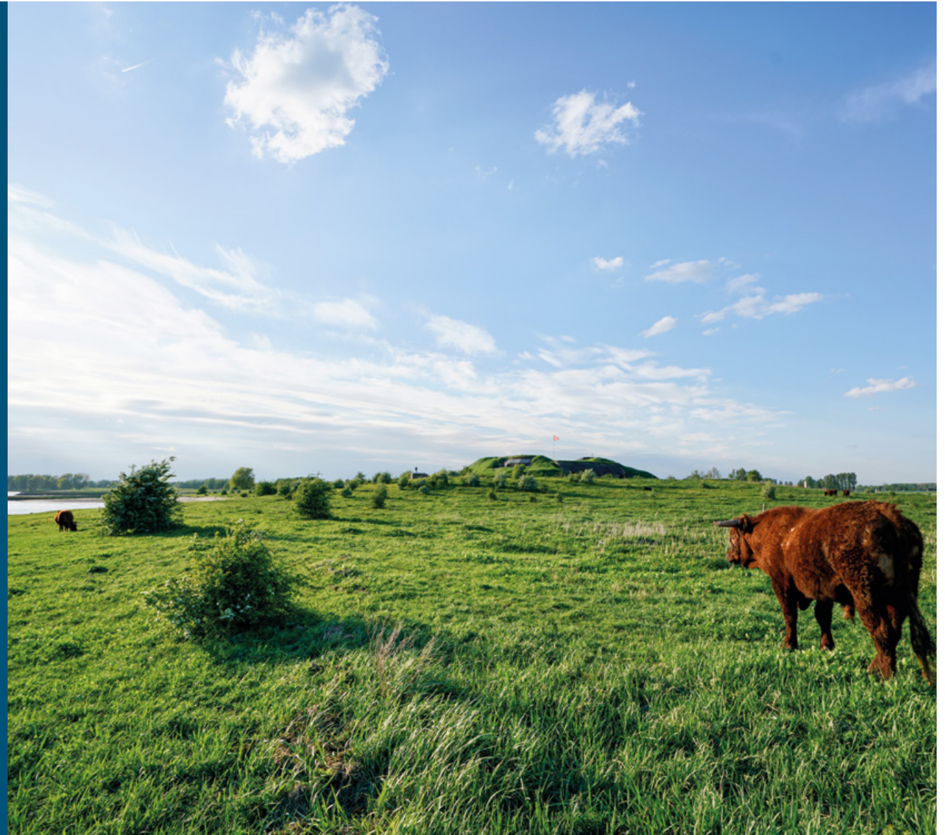
Uiterwaarden bij Fort Pannerden met begrazing door rode Geuzen | Twan Teunissen, Staatsbosbeheer

In de Klompewaard leeft sinds enkele jaren de weidesprinkhaan. Deze sprinkhaan is waarschijnlijk in 1946 uitgestorven in Nederland, maar is nu teruggekeerd op de zandige oeverwallen en de verdedigingswallen van het magistrale fort Pannerden bij de Klompewaard. Vanuit dit gebied verspreidt de soort zich verder naar uiterwaarden aan de overkant van de Waal. Het is een van de successen van dit kleine gebied op de splitsing van de Waal en het Pannerdensch Kanaal. Ook andere pioniersoorten die heel lang zeldzaam waren, doen het hier weer goed, zoals slijkgroen en klein vlooienkruid. Polei, een muntachtige die bijna niet meer voorkomt in Nederland, is hier massaal aanwezig. Het konijn is inmiddels op de Rode Lijst beland, maar heeft hier een gezonde populatie. Al deze soorten profiteren van begrazing door paarden en runderen.