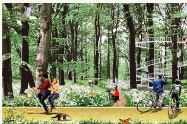
Impressie van een mogelijke bosicoon.

Om het stadsbos van de toekomst zowel voor mens als natuur aantrekkelijk te maken krijgt het bos een zonering in drie zogenoemde bossferen: Parkbos, Wildbos en Puurbos. Iedere bossfeer heeft een unieke identiteit. Een belangrijk streven is om het Stadsbos Almeerderhout als één bosgebied te ervaren in plaats van deelgebieden los van elkaar. Een van de belangrijke ingrediënten voor een goede beleving en optimale bereikbaarheid is dat de aanleg van het 'boscircuit'. Dit is straks de centrale recreatieve ontsluitingsroute in het stadsbos die alle bossferen en bijzondere aantrekkelijke plekken, de 'bosiconen' met elkaar verbindt.