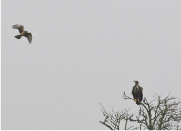
Zeearend wordt geattaqueerd door Blauwe Kiekendief.