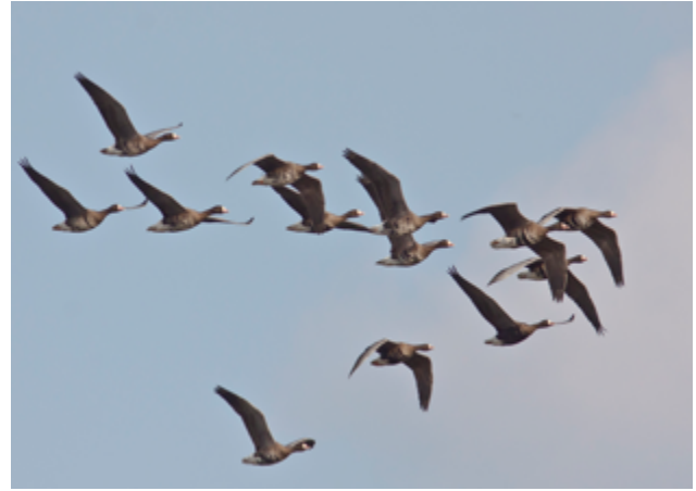
De kolgans, herkenbaar aan zijn witte snavelbasis.

is een zeearendpaar ook weer met een nest bezig. We weten nog niet of het oude bekenden zijn, maar we gunnen ze alle rust bij hun bouwactiviteiten en blijven dus op gepaste afstand. Zie ook de blogs van de boswachters. Link naar Boswachterslog 1 en Boswachtersblog 2 .