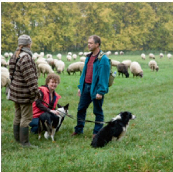
Als u vroeg gaat wandelen kunt u de herder ontmoeten

en andere akkerkruiden die 's zomers tussen het graan bloeien, versterken het historische beeld. Uniek aan de Noordesch is dat hij al eeuwen op dezelfde manier wordt bewerkt en al die tijd nauwelijks is veranderd. Daarom is hij bestempeld tot archeologisch monument.