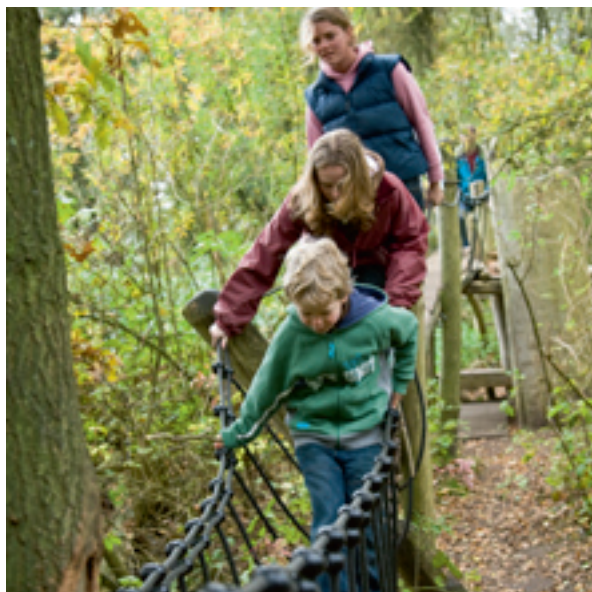
Het houten pad van Theodore is een verhaal over een avontuurlijk varkentje, dat kinderen zelf kunnen beleven

omheen liep. Het herstelde ven is ‘Vlasveentje’ gedoopt omdat bij het uitgraven bosjes vlas tevoorschijn kwamen. Die vondst geeft aan dat dit ven, net als andere vennen in Drenthe, vroeger is gebruikt om er vlas in te ‘rotten’. Daarbij werd het vlas minstens een week lang ondergedompeld in water om de vezels los te weken. De vlasteelt in Orvelte heeft een markante geschiedenis: van 1917 tot 1968 stond hier de enige Drentse vlasfabriek.