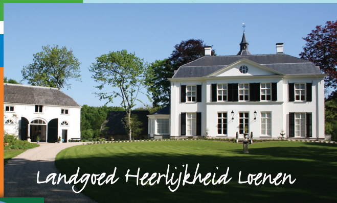
Landgoed Heerlijkheid Loenen

De wandelroute Rondje Landgoed leidt u over het prachtige Landgoed Heerlijkheid Loenen. Het landgoed bestaat al meer dan duizend jaar. Het landgoed met bijbehorende koetshuis en orangerie ligt aan de Waal in een uitgestrekt beschermd natuurgebied. Het Landgoed Loenen heeft een nat essen- en eikenbos. Er stond een kasteel op de plaats waar tegenwoordig het adellijk huis Loenen staat.